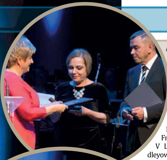
Moment wręczenia odznaczenia „Zasłużony dla Mazowsza”