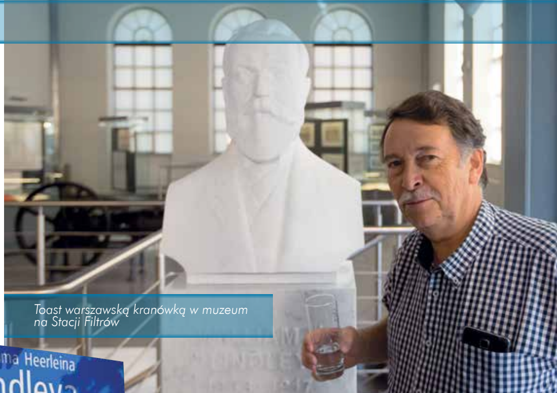
Toast warszawską kranówką w muzeum na Stacji Filtrów